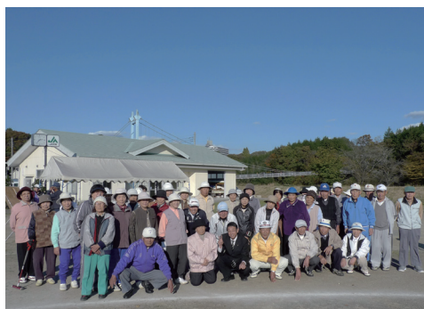
試合後の集合写真