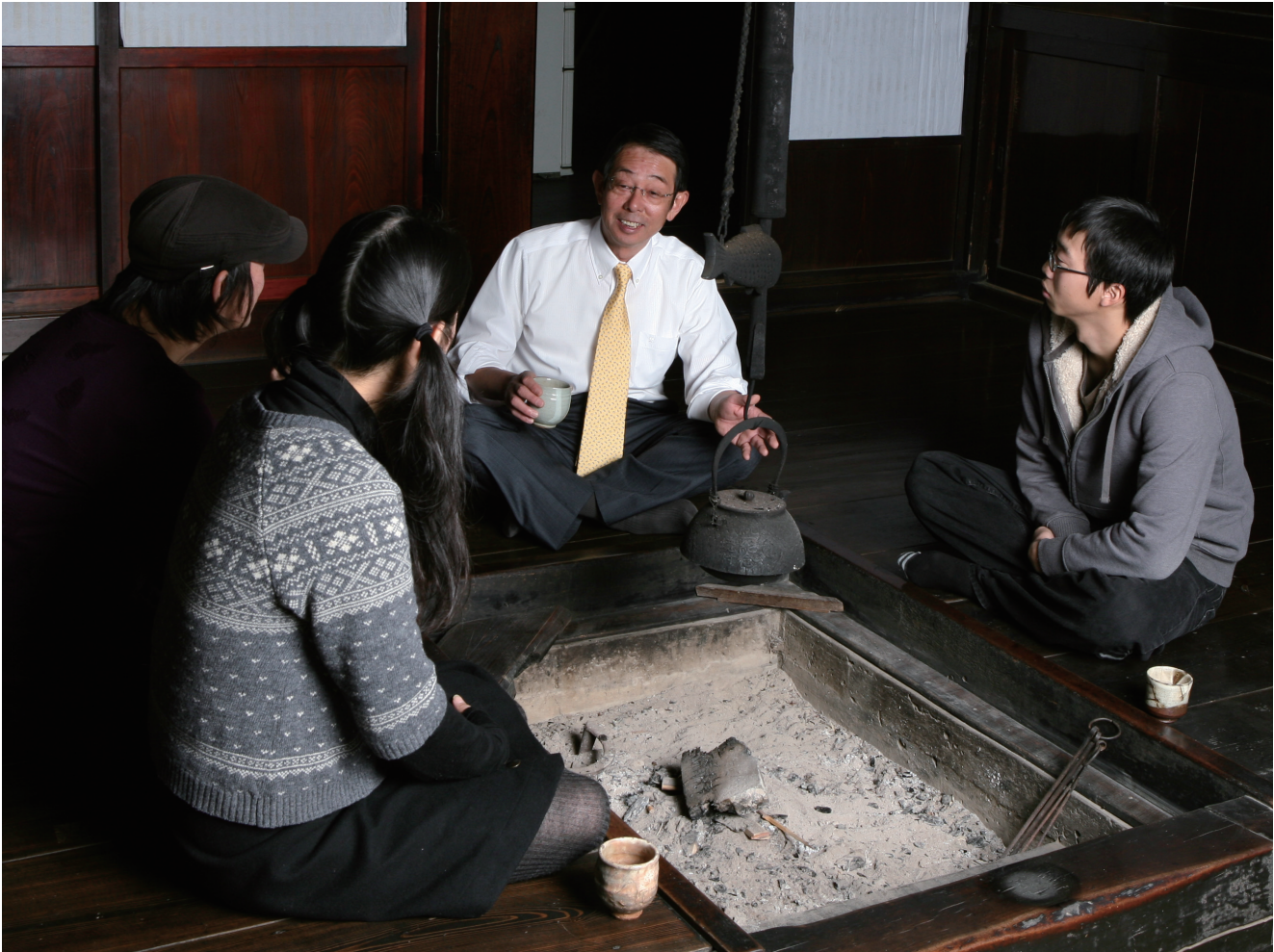
那須烏山市下境の古民家での語らい