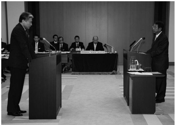
10月6日 予算特別委員での質疑

特に、質問は会派の人数で年間の質問時間が決められています。その他、条例や意見書の提出なども最大会派である自民党が主体となって提案し採決される仕組みになっています。